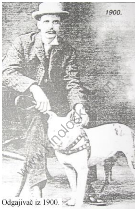
Odgajivač iz 1900.

U Irskoj u periodu od 1845. do 1851. godine, vladala je velika glad jer je prinos krompira podbacivao godinu za godinom. U pravcu Amerike, krenula je prava reka kolonista tako da se broj stanovnika Irske