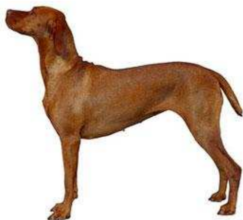
KRATKODLAKA MAĐARSKA VIŽLA