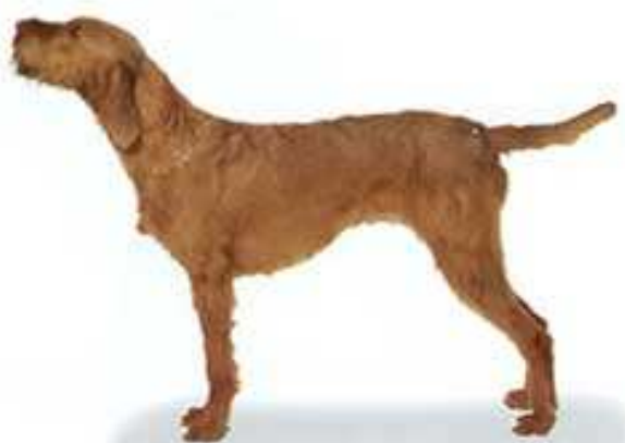
OŠTRODLAKA MAĐARSKA VIŽLA