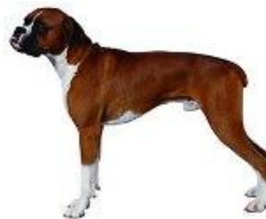
Nekorektna leđna linija