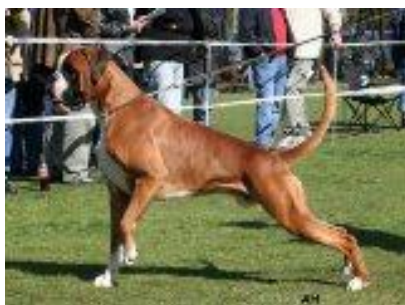
Pravilna gornja i donja linija

Česta greška je i blago zaobljen slabinski deo leđa, ali mnogo veća mana koja se prenosi na potomstvo, jesu šaranasta leđa.