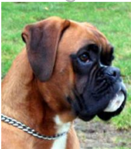
Pravilno usađene i nošene nekupirane uši

Uši visoko postavljene kupirane u vrh, srazmerno duge i uspravno nošene, u bazi ne preširoke. Nekupirane uši imaju prikladnu dužinu pre su male nego velike, tanke, postavljene su sa obe strane u najvišoj tački lobanje, daleko su međusobno razmaknute. U mirovanju leže uz obraze, a kada je pas na oprezu, uši trba da s jednim jasnim naborom padaju prema napred.