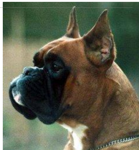
Pravilno usađene i nošene kupirane uši