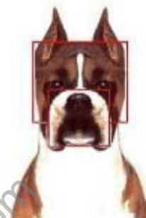
Pravine proporcije glave, front

Uši visoko postavljene kupirane u vrh, srazmerno duge i uspravno nošene, u bazi ne preširoke. Nekupirane uši imaju prikladnu dužinu pre su male nego velike, tanke, postavljene su sa obe strane u najvišoj tački lobanje, daleko su međusobno razmaknute. U mirovanju leže uz obraze, a kada je pas na oprezu, uši trba da s jednim jasnim naborom padaju prema napred.