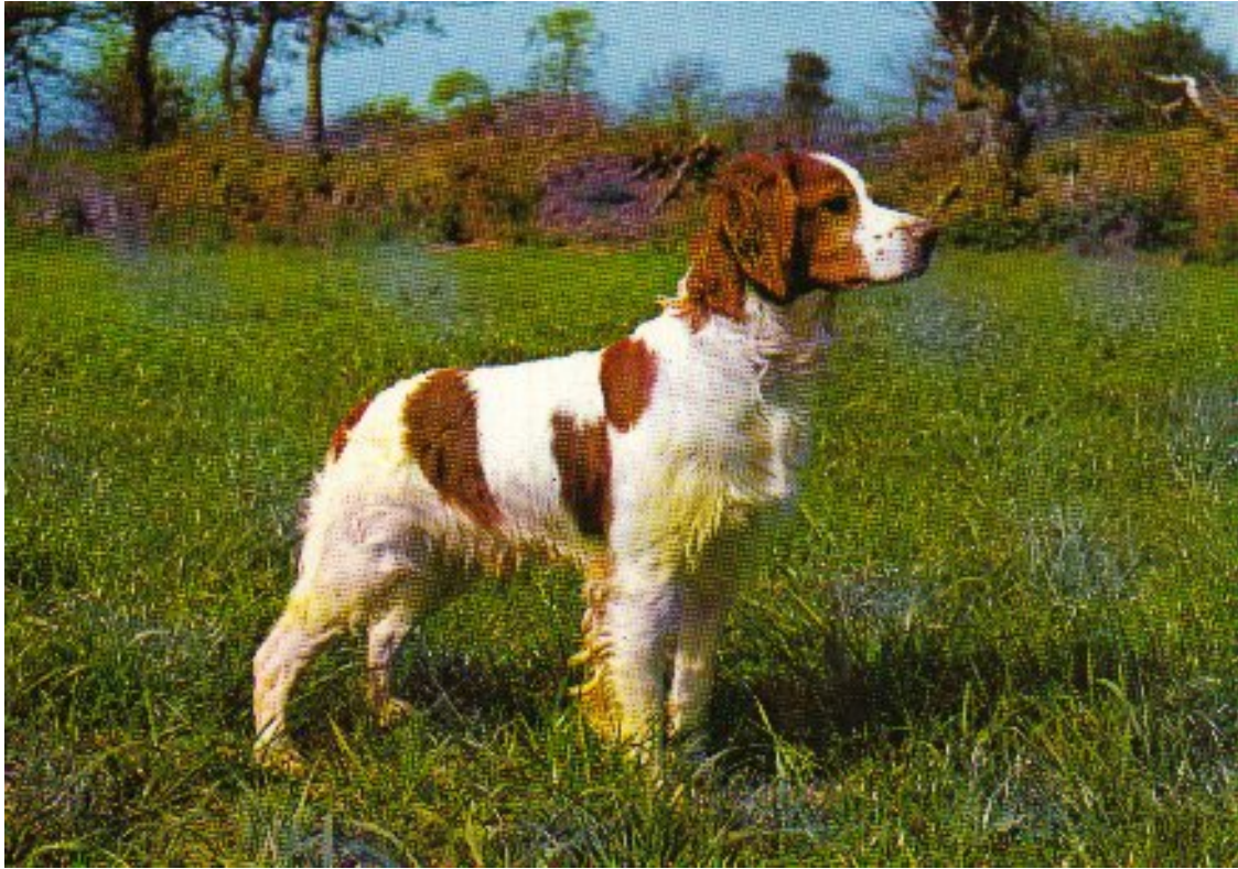
PoulTou de Keranlouan - 1971 - CH T, IT, IB, B

Још давно пре него што је добио признање за племенитост своје расе, његови преци оставили су му у наслеђе многе врлине, а посебно међу њима издржљивост, срчаност, упорност и велику лакоћу прилагођавања сваком терену. Погодан је за лов свих врста пернате и длакаве дивљачи.