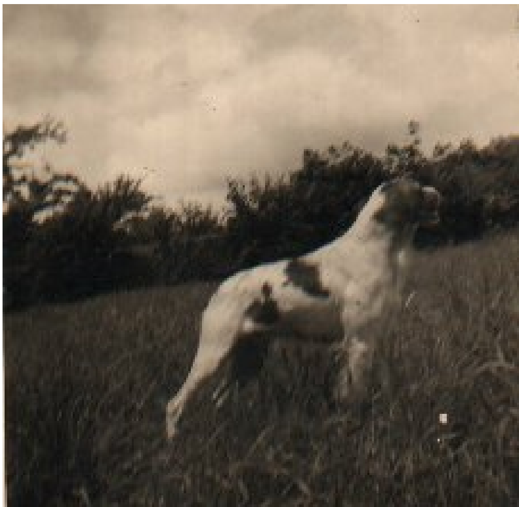
Istor de Keranlouan en 1962 (CH T).