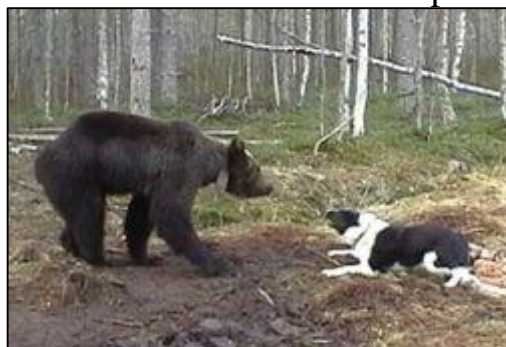
I sad J