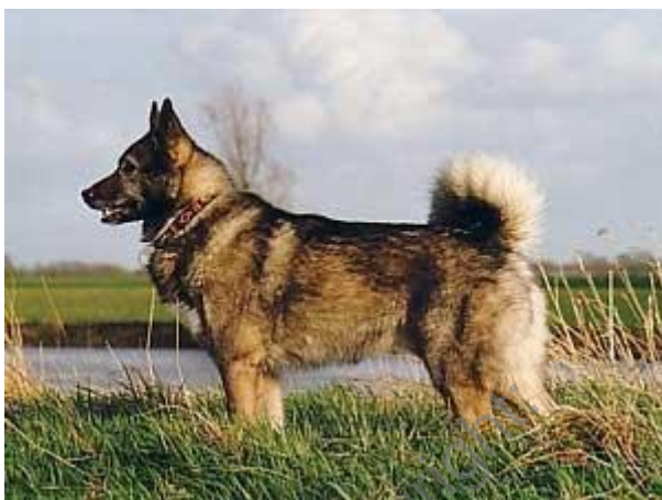
Zapadno Sibirski Lajka

Ruske lajke su multifunkcionalni lovački psi, koriste se u velikoj meri za lov u sumama Sibira, od strane profesionalnih lovaca. Postoji 3 varijeteta laiki koje su priznate od strane FCI i to: Zapadno-sibirski lajka, Istočno-sibirski lajka i Rusko-evropska lajka. Poslednja (REL) je tesno povezana sa Karelijskim goncem medveda. Postoji i 4 tip, koji se može pronaći samo u Rusiji i nije priznat od strane FCI: Karelo-finska lajka. Ovaj tip izuzetno podseća na Finskog špica. Najverovatnije je to ista rasa, koja je podeljena usled razdvajanja zemanja i uspostavljanja granica.