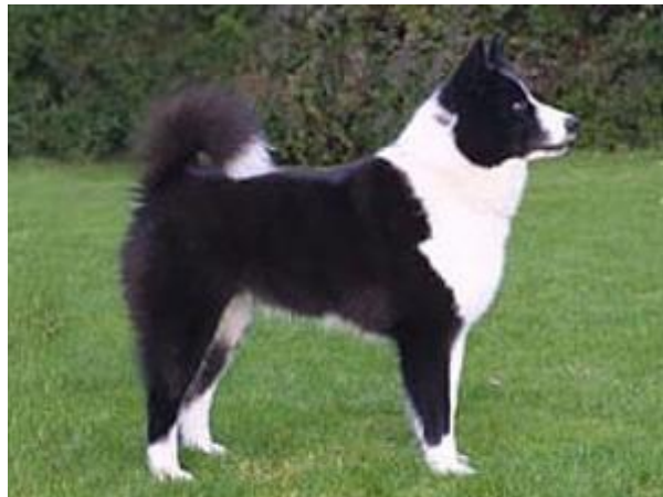
Karelijski Gonič Medveda

Pre više od 10. godina osnovan je 'Russian Kennel Club'. Pre toga postojala su udruženja lovaca i njihovih pasa, radnih pasa i izložbenih pasa. Lovci međutim nisu toliko potencirali na eksterijeru ovih pasa, njih je samo zanimalo da sačuvaju originalne lovačke sposobnosti ovih pasa.