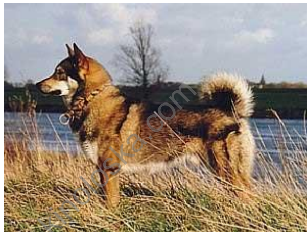
Istočno Sibirski lajka

Lajke su psi špic tipa, drevni tip pasa, koji je karakteristican za celu severnu hemisferu. U severnim zemljama može se naći nekoliko regionalnih varijacija špiceva. Neki od njih se koriste za lov, neki se koriste kao ovčarski psi, psi čuvari ili kao zaprežni psi. Vekovima, ovu rasu je razvijala prirodna selekcija. Tek u poslednjih nekoliko decenija, vršena je rigorozna selekcija. Lajke moraju biti spremne na ekstremne uslove, kao što je hladnoća, sneg, i takođe moraju biti dovoljno inteligentne da prežive u takvim uslovima ukoliko ostanu same.