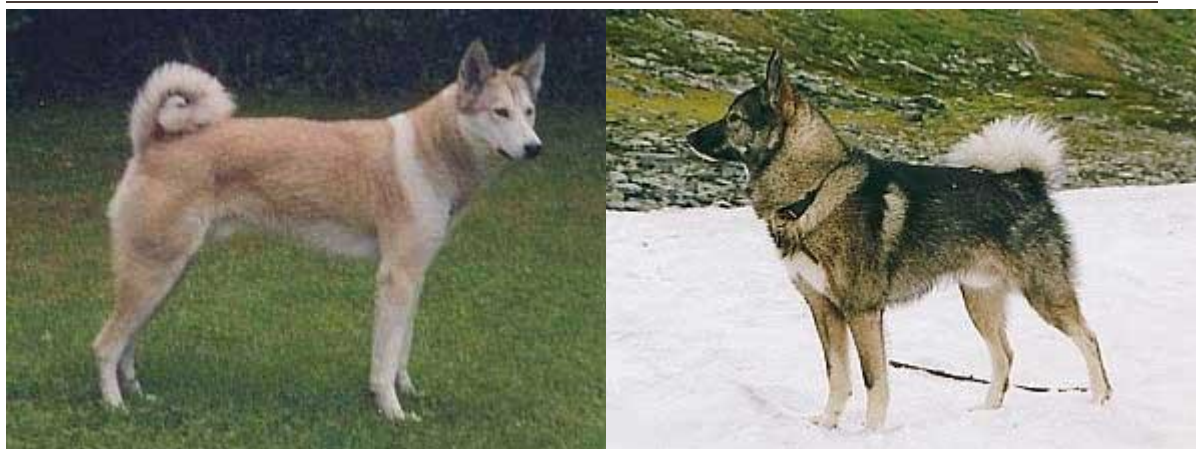
Dva tipa zapadno-sibirske lajke

Rasa je stvorena ukrštanjem srodnih, Hantajske i Mansijske lajke, kao i pasa ruskih lovaca u regionu severnog Urala i zapadnog Sibira. Ova lajka, osim matičnog regiona, raširena je i u predelu srednje Rusije, gde je ima u priličnom broju, a gaji se i u velikim odgajivačnicama. Snažne, "suve" konstitucije, srednje veličine. Visina grebena mužjaka 54-60 cm, ženki 51-58 cm. Indeks dužine tela mužjaka 103-107, a kod ženki 104-108.