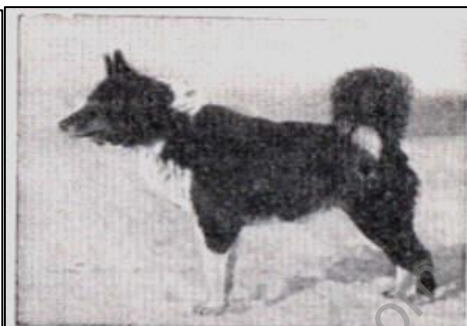
Champion Pootik 1953